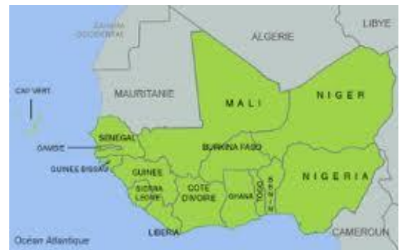
Figure 2 – Les 15 Etats membres de la CEDEAO

En 2008, les Chefs d'Etat de la CEDEAO ont adopté sa Politique environnementale par l'Acte additionnel A/SA.4/12/08.