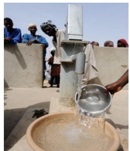
Figure 3 - Fontaine au Sahel

Eau : la Politique régionale de l'eau (PREAU), associe le CILSS, l'UEMOA et CEDEAO. Egalement adoptée en 2008, elle vise à orienter la CEDEAO et ses Etats membres vers une gestion des ressources en eau conciliant développement économique, équité sociale et préservation de l'environnement (A/SA.5/12/08). Ses axes stratégiques sont bien en conformité avec les dimensions du développement durable, la Convention cadre des Nations-Unies sur le changement climatique (CCNUCC) et la Vision ouest-africaine pour l'eau, la vie et l'environnement pour 2025 définie en 2000 par la CEDEAO ;