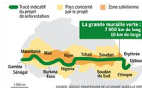
Figure 6 – Initiative africaine de la Grande muraille verte

L'Initiative africaine de la grande muraille verte (IAGMV) a été lancée en 2007 par les Etats saharo-sahéliens afin de faire face aux changements climatiques et autres impacts anthropiques (surpâturage, défriche-brûlis, feux de brousse, etc.) qui aggravent ces changements climatiques, ainsi que la désertification et la dégradation des terres.