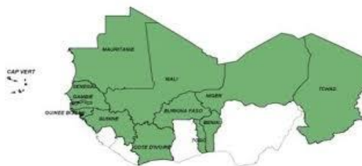
Figure 5 - Les 13 États membres du CILSS

Créé en 1973 en réponse à la sécheresse des années 1970, le CILSS a cinq missions :