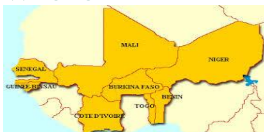
Figure 4 - Les 8 États membres de l'UEMOA

En 2008, elle a adopté la Politique commune d'amélioration de l'environnement (PCAE) par l'Acte additionnel N° 01/2008/CCEG/UEMOA du 17 janvier 2008. La PCAE répond aux orientations contenues dans le Traité de l'UEMOA, notamment à son Protocole Additionnel N°II relatif aux Politiques sectorielles, lequel établit l'environnement comme secteur d'intervention de l'UEMOA.